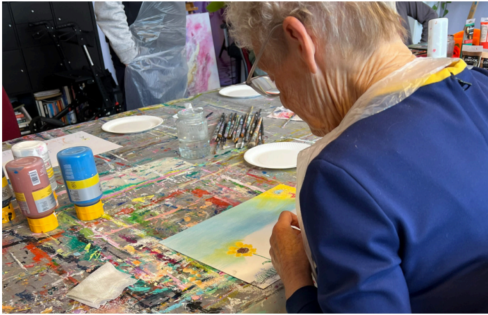
Schilderen bij de burens 'Zielsgewoon Manja'