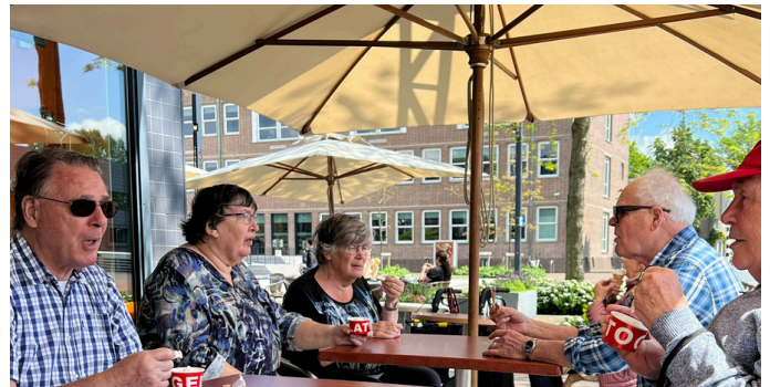
Met mooi weer gaan we regelmatig wandelen langs de haven en nemen we pauze op het terras bij het Raadhuisplein onder het genot van een ijsje