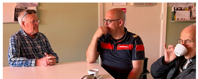
De brandweer op de koffie en er komt nog een verrassing voor onze bezoekers