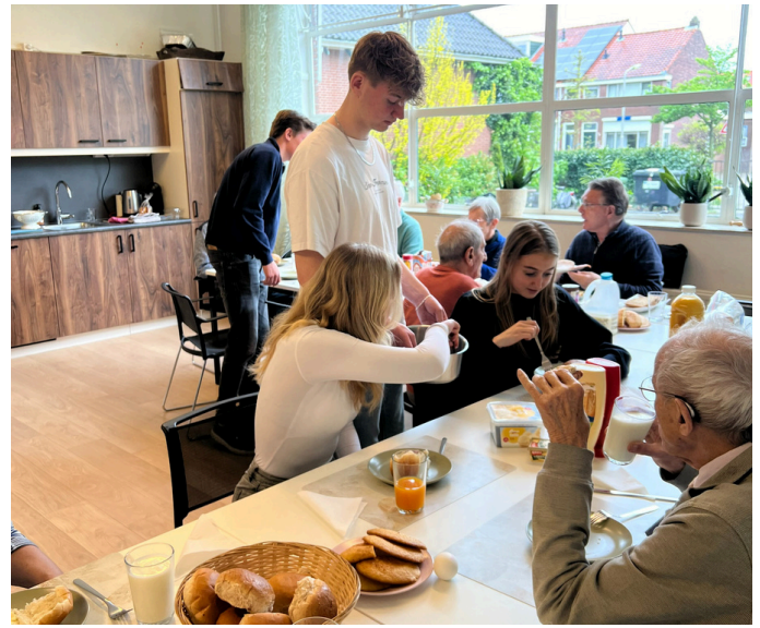
Studenten van DaVinci College hebben een heerlijke lunch verzorgd