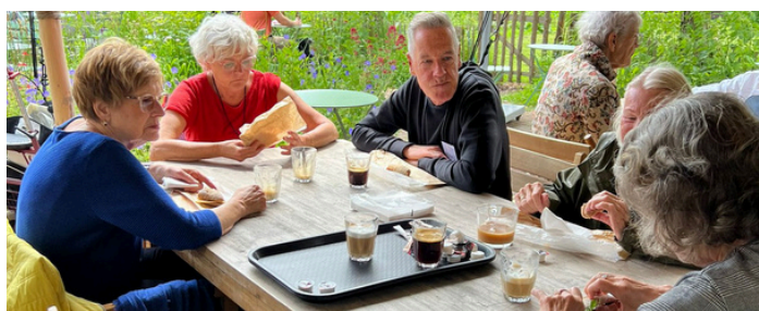
De laatste donderdag van mei hebben we een prachtige wandeling gemaakt in de Biesbosch met aansluitend een heerlijke lunch bij Biezz