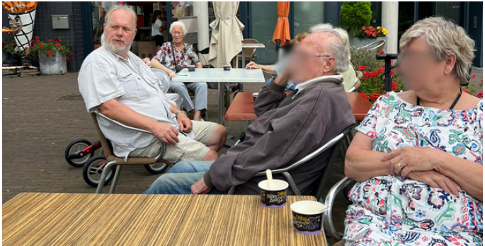
Met de warme dagen gaan we regelmatig een ijsje eten