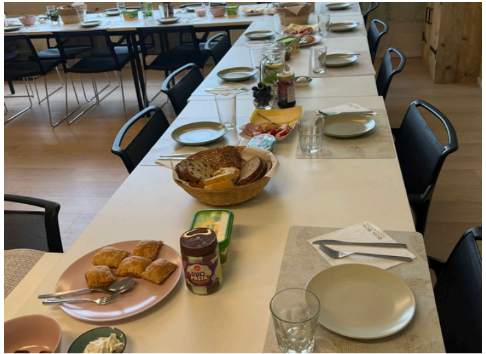
Tijdens de themawEEK hadden we een heerlijke lunch uit het buitenland