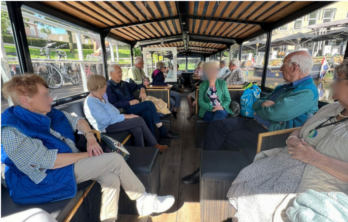
We hebben een heerlijke boottocht gemaakt door de polders en langs de molens