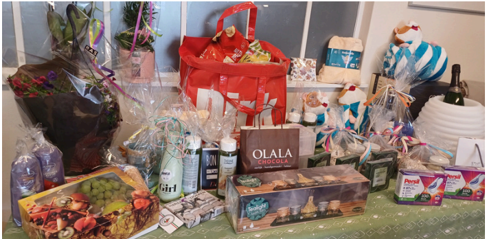
Op het zomerfeest was er veel animo voor onze loterij