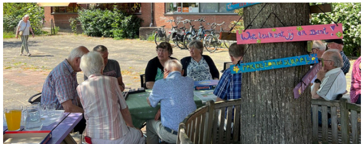
We spelen regelmatig een spelletje op het plein