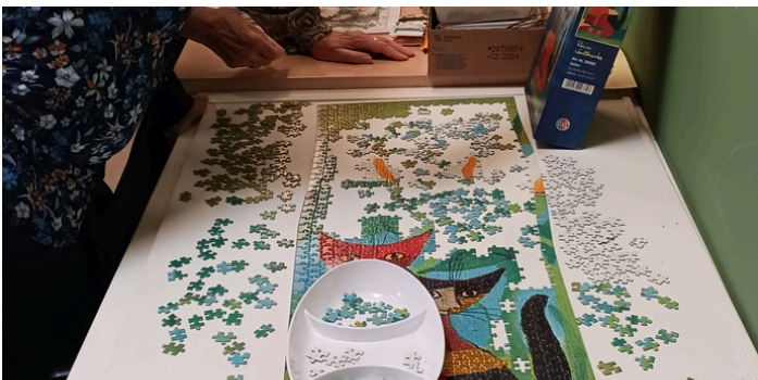
Lekker puzzelen behoort ook tot één van onze activiteiten. Help je mee?