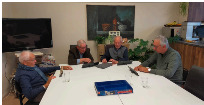
Rummikub... wie is er niet groot mee geworden?