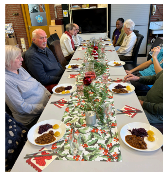
We hebben de week voor kerst de hele week een kerst lunch gehad met allemaal lekker eten