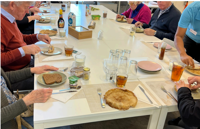
Regelmatig worden onze bezoekers getraceerd op vers gebakken pannenkoeken.